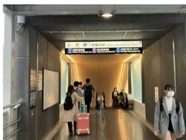
② 5Aで地上出口を直進