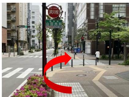
⑩ 「新横浜二丁目中央」交差点を右折