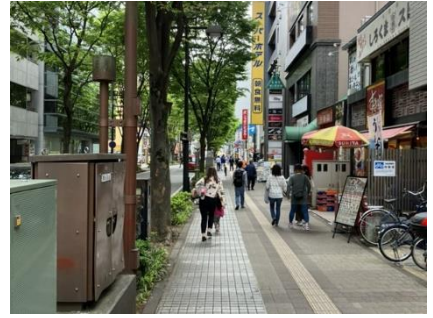
⑫ 交差点左折後直進