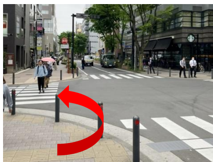
⑧ 降り口より直進、「新横浜二丁目南側」交差点を左折