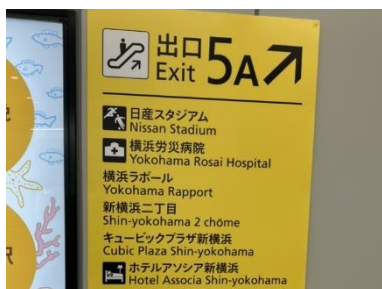
① 地下通路案内5A 方向エスカレーターで地上へ