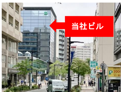
⑪ 右折後直進左前方に当社ビル