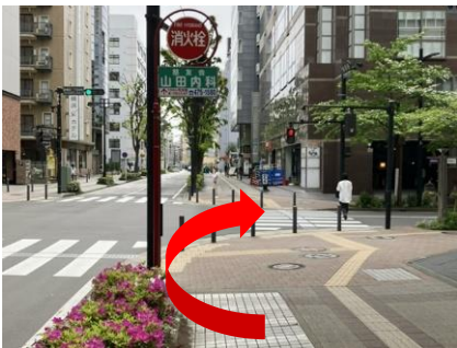
⑬ 「新横浜二丁目中央」交差点を右折