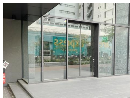
⑫ お疲れ様でした。到着です。