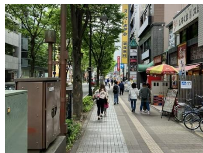
⑨ 交差点左折後直進