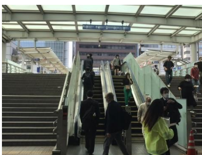
④ エスカレーター上がる