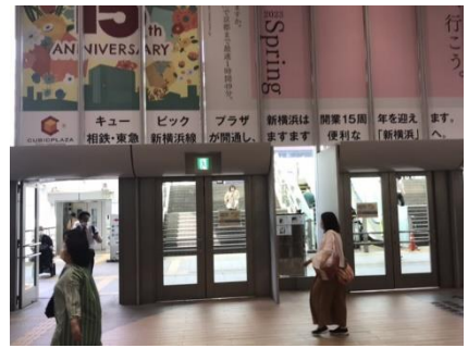
③ 正面扉を抜けエスカレーターを上がる