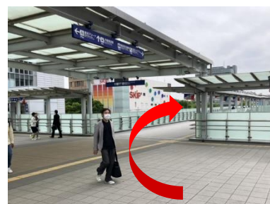
③ 右前方の通路を直進