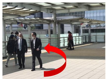
⑥ 最初の路地を左折