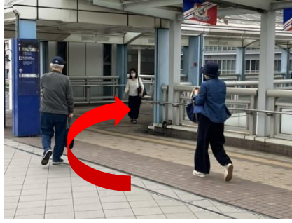
⑧ 突き当りを右折し、直進