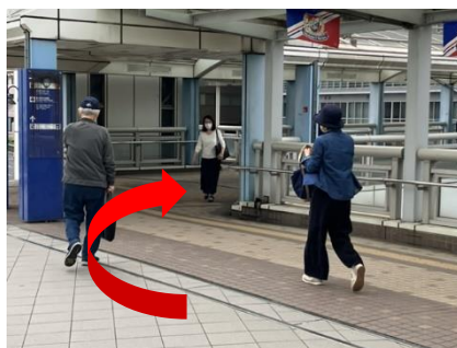
⑤ 突き当りを右折し、直進