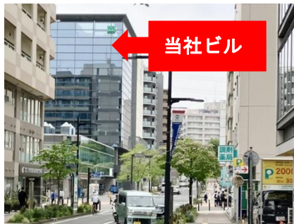
⑭ 右折後直進、左前方に当社ビル