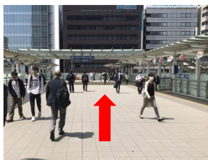
⑤ エスカレーターで上がったら直進