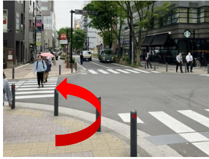
⑪ 降り口より直進、「新横浜二丁目南側」 交差点を左折