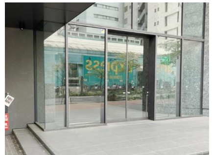
⑮ お疲れ様でした。到着です。